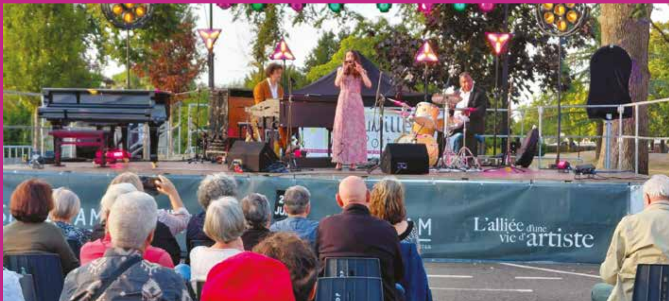
Neuville en jazz