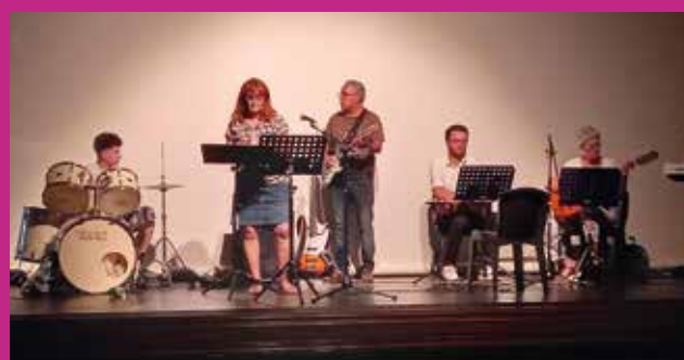
Fête de la musique - EMIM