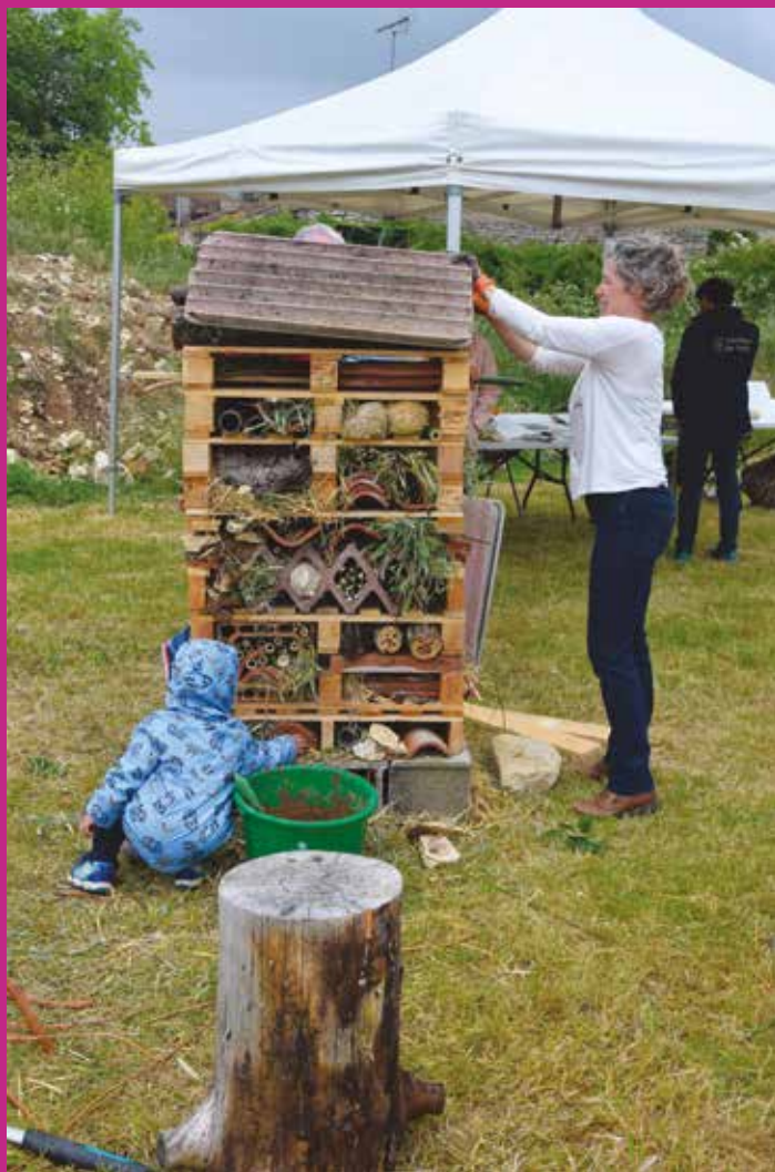
Fête de la nature