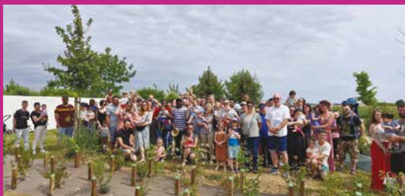
Arbres à bébés