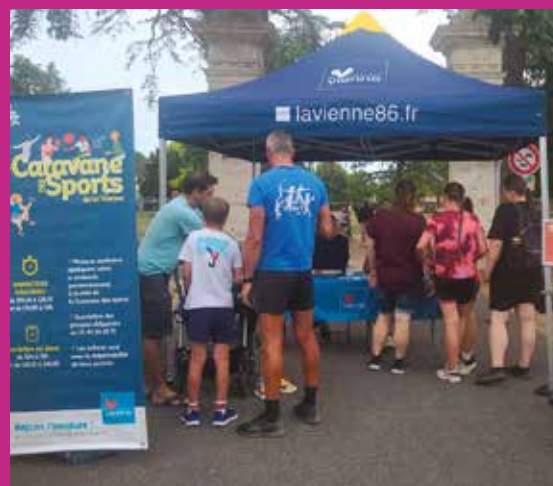
Caravane des sports