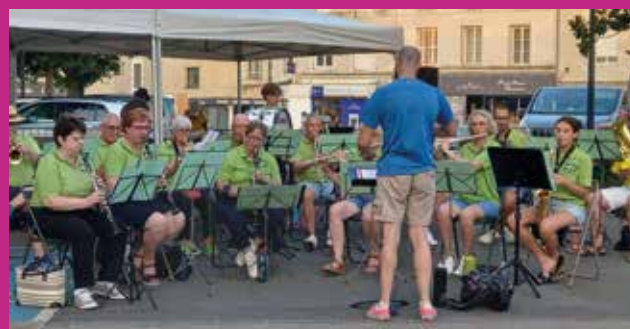
Fête de la musique - Harmonie de Neuville