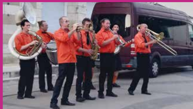
Fête de la musique - Fanfare le SNOB