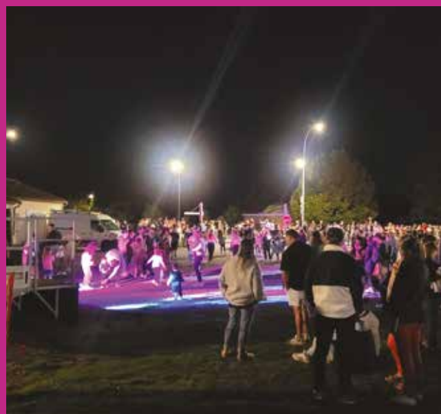
Festivités 6 septembre - report du 13 juillet