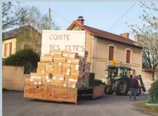
Le déménagement du comité des fêtes

Neuville-en-jazz, le Motoball et AC Neuville disposent également d'un espace dans ce même lieu.