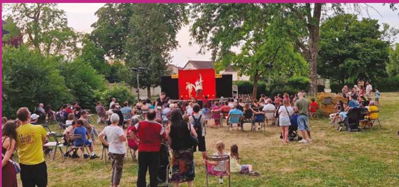
Fête de la Saint-Jean